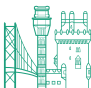
Lisboa T +351 21 382 12 00